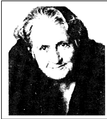
Maria Montessori ( 1870-1952 )

Die italienische Ärztin und Reformpädagogin Maria Montessori entwickelte aus ihren Studien, Erfahrungen und Beobachtungen ein pädagogisches Konzept, dessen zentrale Aufgabe die individuelle Entwicklung und Entfaltung von Kindern und Jugendlichen im sozialen Miteinander zum Ziel hat. Dabei stellte sie einen verständnisvollen Umgang zwischen Erwachsenen und Kindern, die Bedürfnisse der Kinder und die Erziehung zur Selbständigkeit in den Mittelpunkt.